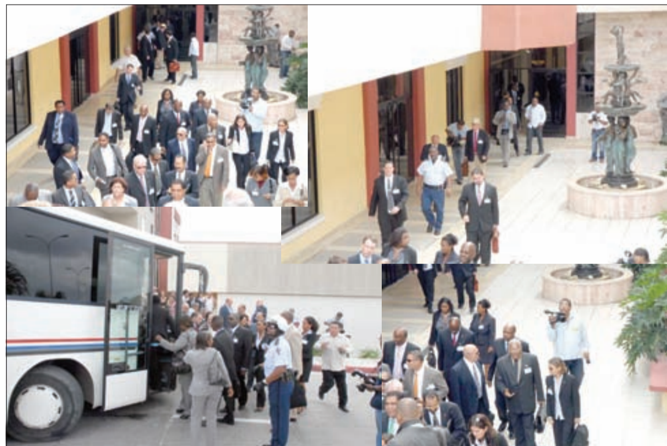
Miembronan di delegacionnan bandonando WTC pa bay Marinebasis Parera despues di menasa di bom